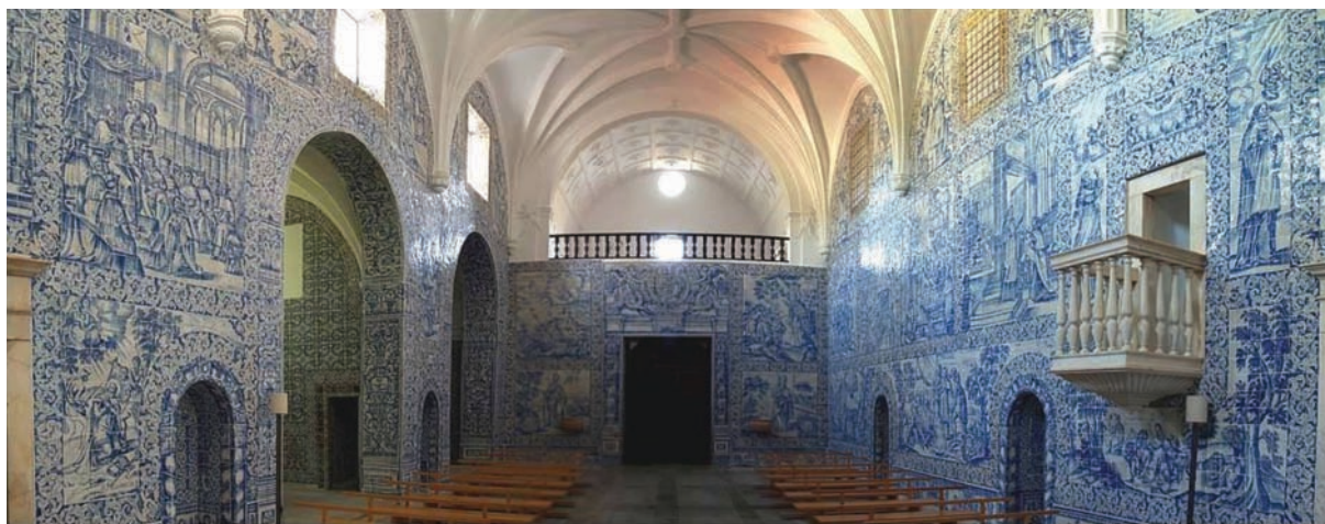
Couvent de Arraiolos, azulejos datés de 1700 de l'atelier de Gabriel del Barc

Ce disque sera l'un des tout premiers enregistrés en France autour du Soundpainting, au sein d'une nouvelle collection du label Musivi, et présentera le Soundpainting dans une version d'excellence.